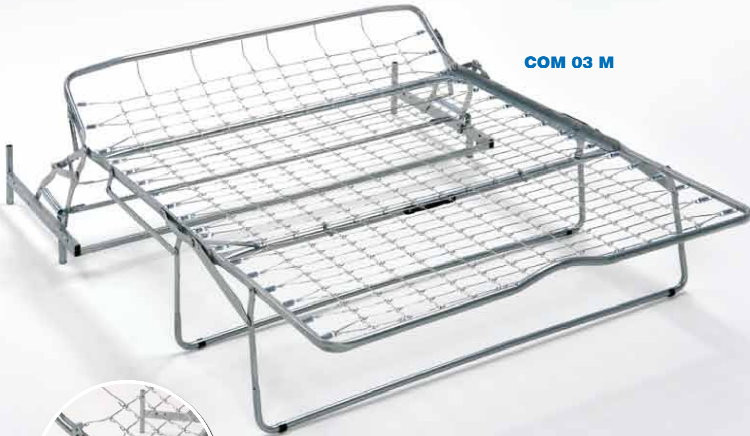
COM 03 M