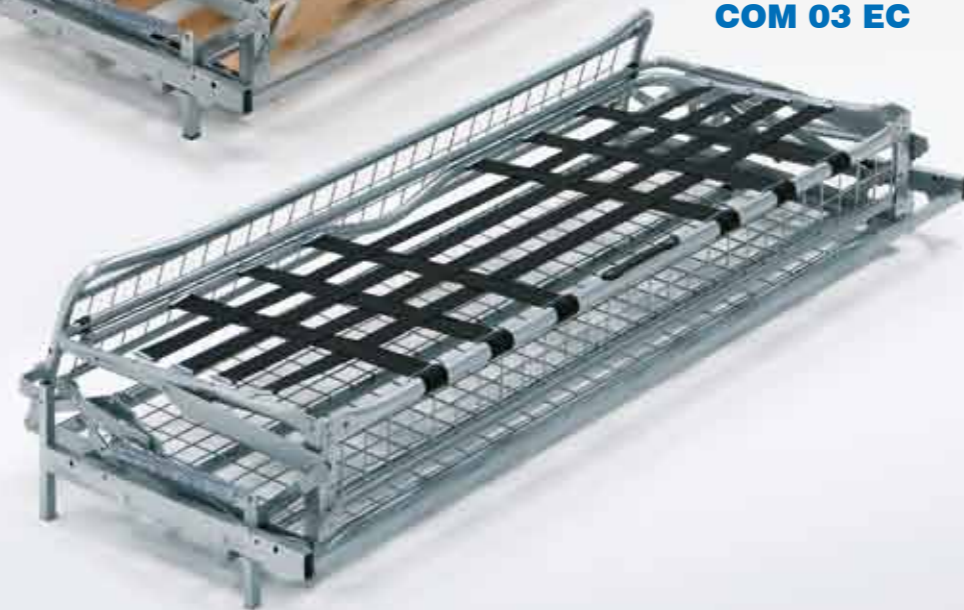
COM 03 EC