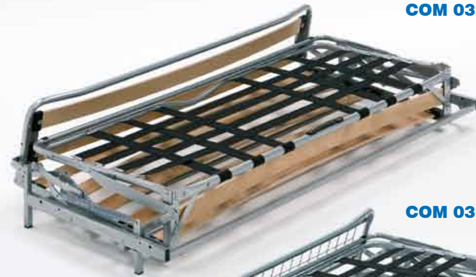
COM 03 DC